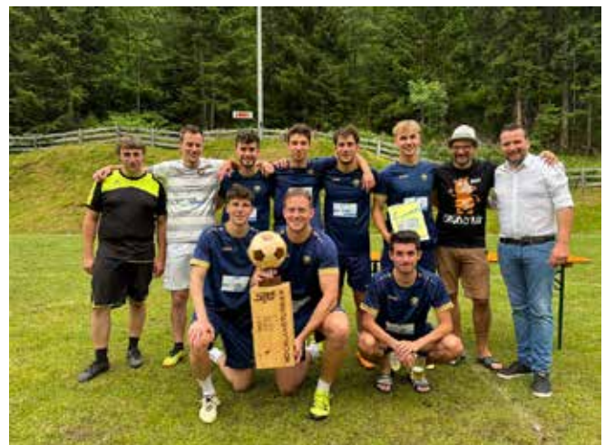
Die Siegermannschaft aus Haiming