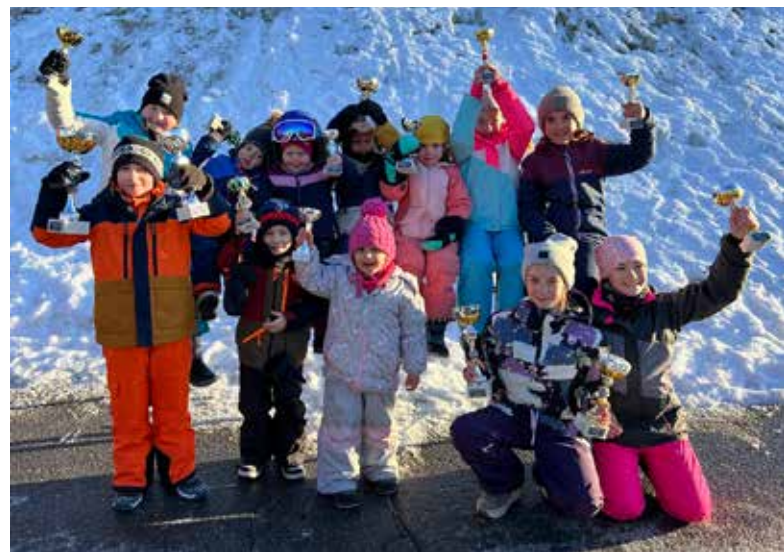
Unsere kleinen Rodler