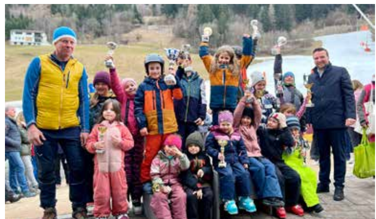
Unser Skinachwuchs

Über den Sommer fanden zudem jeden Freitag Fußballtrainings für Kinder und Erwachsene mit reger Teilnahme statt.