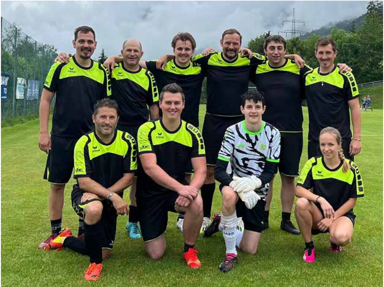
Die erfolgreiche Mannschaft der SPG