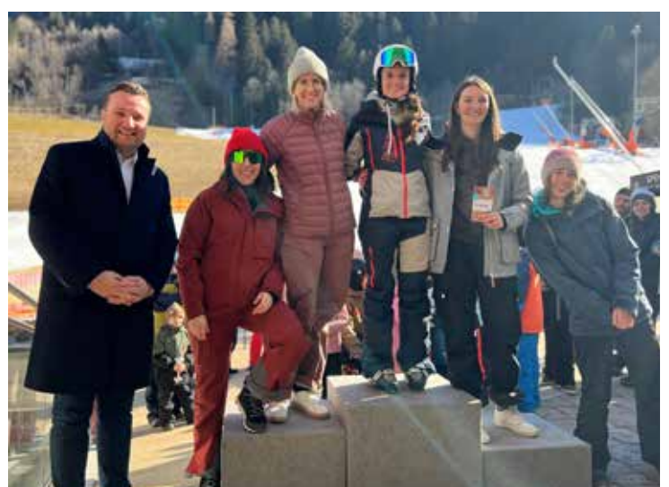
Vereinskirennen SPG Zammerberg